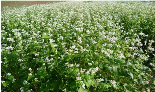
Abb. 1: Buchweizen ist eine intensive Blühpflanze, die mit reichlich Nektar zahlreiche Insekten anlockt, relativ stark verzweigt und flach wurzelt. Die Früchte sind fest von einer Hülle umschlossen, die vor der Weiterverarbeitung entfernt werden muss (Fotos: F. Longin und A. Mrasori).

Alle Foto- und Abbildungsrechte verbleiben bei den Autoren.